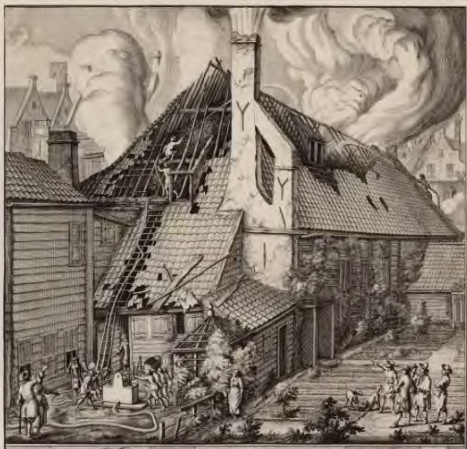
Brand in de zeepziederij 'De Bruinvisch' op 18 april 1682, Looiersgracht ter hoogte van 45-49