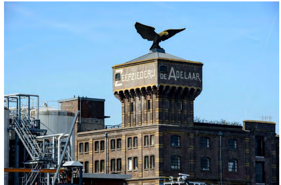
De voormalige zeepziederij "De Adelaar" te Wormerveer