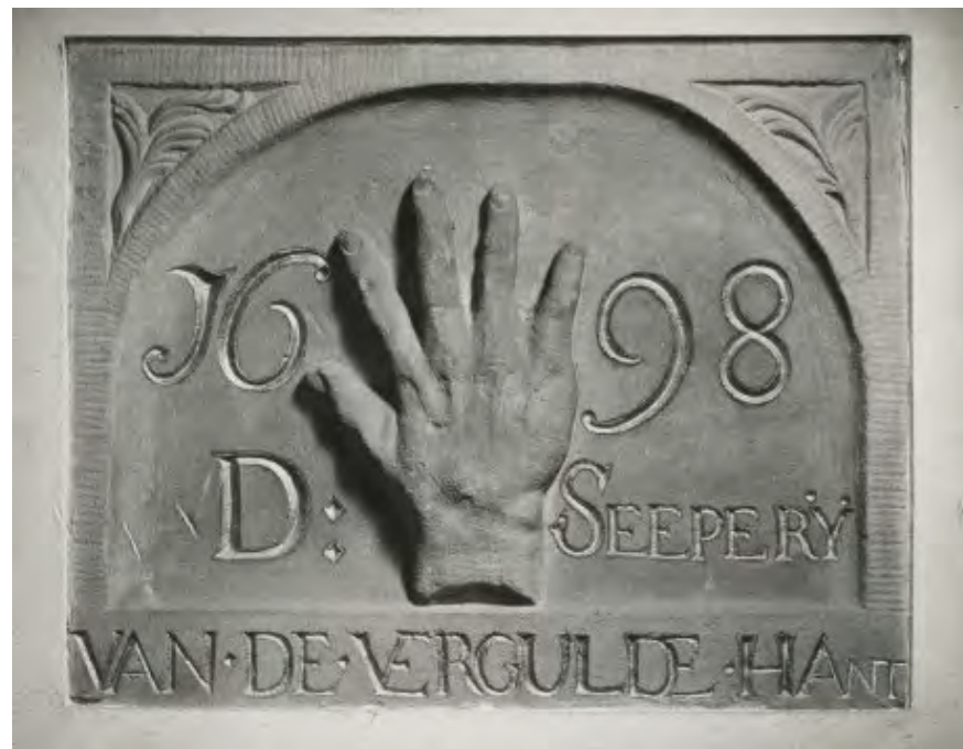
Gevelsteen van 'Zeepfabriek De Vergulde Hand', Damrak 15. Foto uit 1950.