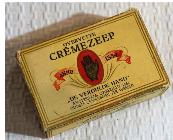
Overvette crèmezeep van de oudste zeepfabriek ter wereld