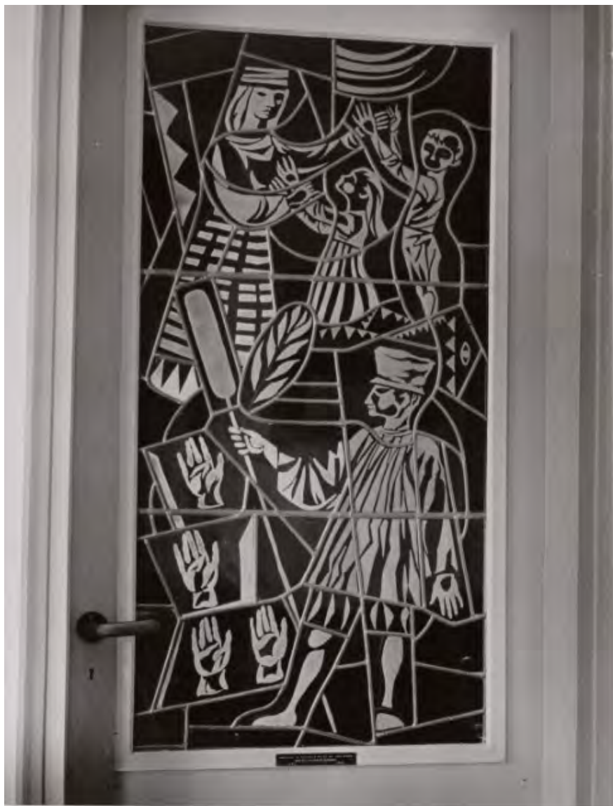
Damrak 15-16 Zeepfabriek "de Vergulde Hand". Glas-in-loodraam in deur tussen kantoor en directiekamer.