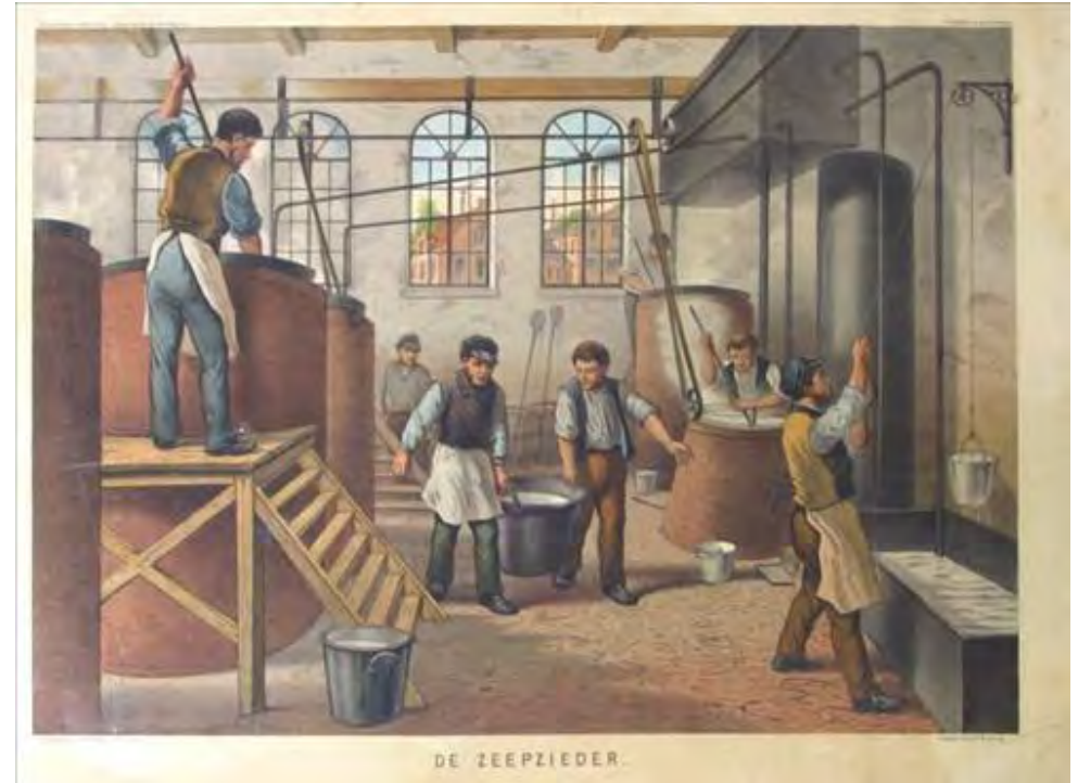
Schoolplaat van 'De zeepzieder'