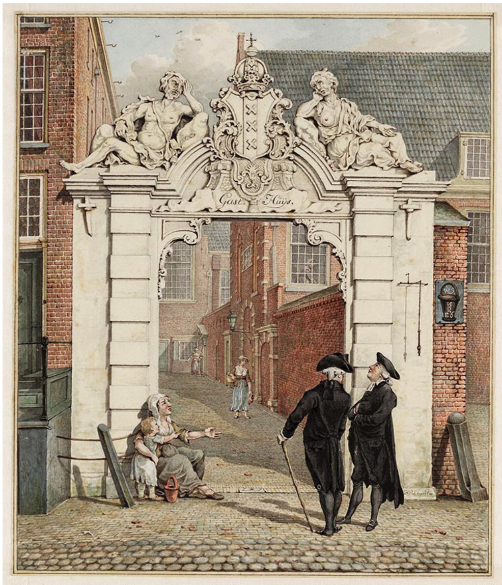
▲ Gasthuispoort aan het eind van de Grimburgwal, entree Binnengasthuis; H.P.Schouten - 1793 Binnengasthuis, binnenplaats met voormalig Anatomisch Theater (snijzaal), daarna interne kliniek 1981

zien hoe het ziekenhuis in die tijd nog steeds gevestigd was in de oude kloostergebouwen en -kerken. Dit gasthuis was voornamelijk bedoeld voor armen, soldaten, matrozen en reizigers. Er was een mannen- en een vrouwenafdeling, een afdeling voor chirurgische patiënten, een apotheek, een 'snijzaal' (anatomisch theater) en een 'baaierd' (rustzaal). Het bestuur van het Binnengasthuis lag in handen van de burgemeesters van Amsterdam. In de nabijgelegen Waag, een voormalige stadspoort die in 1690-'91 aanzienlijk was verbouwd, werden anatomische lessen gegeven.