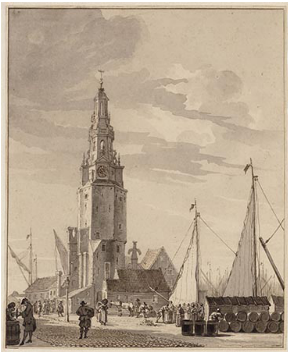
▲ Haringpakkerstoren in 1766 - tekening door Reinier Vinkeles ▶ Haringpakkerstoren in 1755 - aquarel door Jan de Beijer

Eeuwenlang was Amsterdam een ommuurde vestingstad met poorten die 's avonds op slot gingen en pas 's ochtends weer geopend werden. De haven aan het IJ was voorzien van een palenrij met toegangspoorten die 's avonds gesloten werden met zogenaamde bomen. Het kwam geregeld voor dat reizigers een gesloten stad troffen als ze hier aankwamen. Om deze reizigers tegemoet te komen, liet het stadsbestuur in 1614 een opvanghuis voor gestrande reizigers inrichten. Deze 'Stadsherberg' stond op houten palen in het IJ-water, aan de westkant van het havenfront, ter hoogte van de huidige Droogbak. In 1662 kreeg Amsterdam er een tweede bij, die al gauw 'De Nieuwe Stadsherberg' genoemd werd, ten oosten van de nu 'Oude Stadsherberg'. Voor een betere aansluiting op de trekvaart naar de Waterlandse steden was er door de Volewijck (de