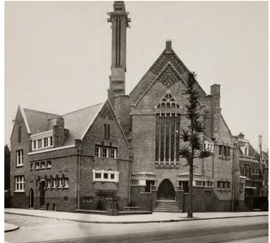
De 'Nederlands-Israëlitische Synagoge' aan de Linnaeusstraat 1928 – 1962 Links: ingang Polderweg.