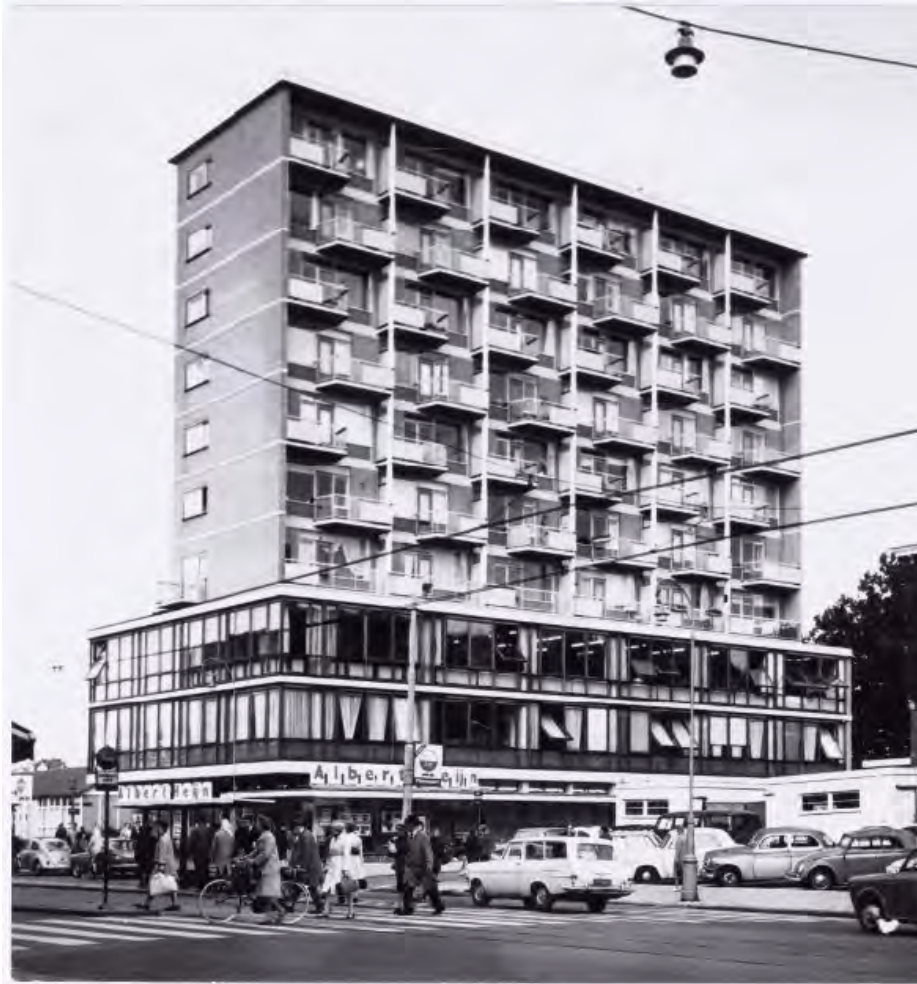
Linnaeusstraat 119, woningen voor alleenstaanden.