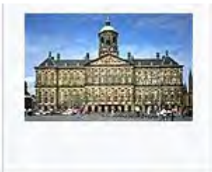
Paleis op de Dam,

6c01cb4767a4?mode=detail&view=horizontal&q=keizersgracht%20102&rows=1&page=2