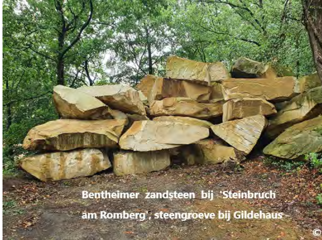
Bentheimer zandsteen bij 'Steinbruch am Romberg', steengroeve bij Gildehaus