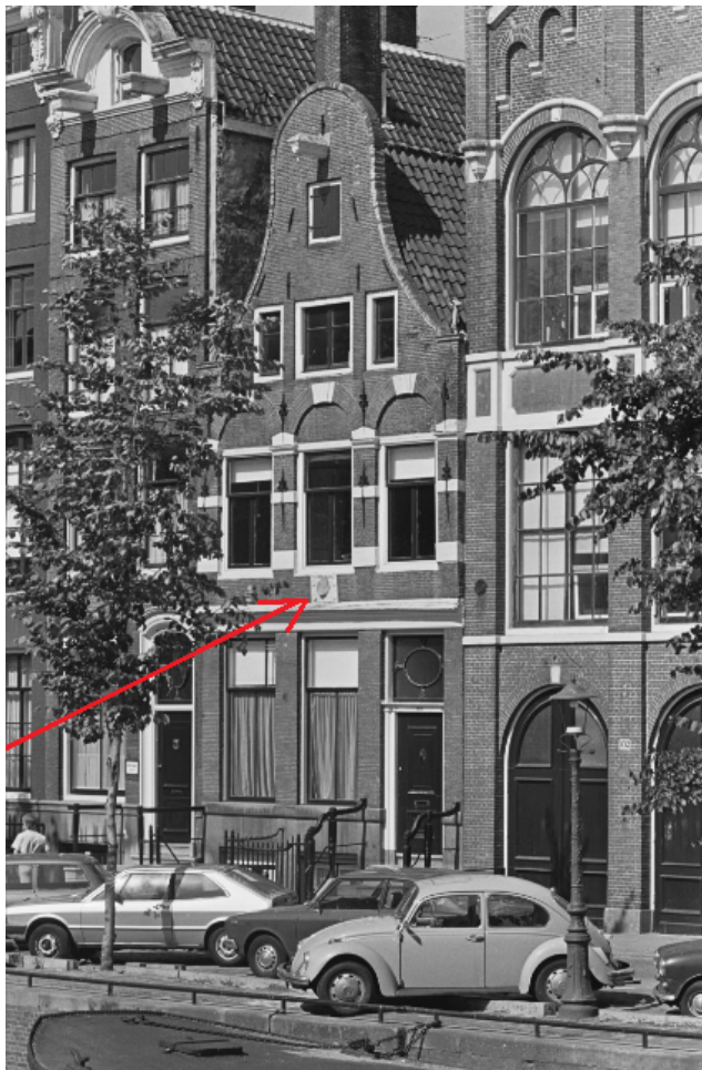
Keizersgracht 102 (ged.) - 108 v.r.n.l., voorgevels

NB Bij de rode pijl de betreffende hoedengevelsteen