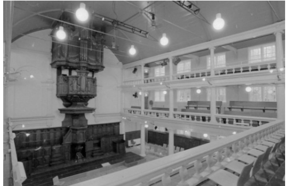
Keizersgracht 102, ' Rode Hoed ', interieur met preekstoel en orgel

http://www.gevelstenen.net/kerninventarisatie/plaatsenNed/%25Amsterdam.htm