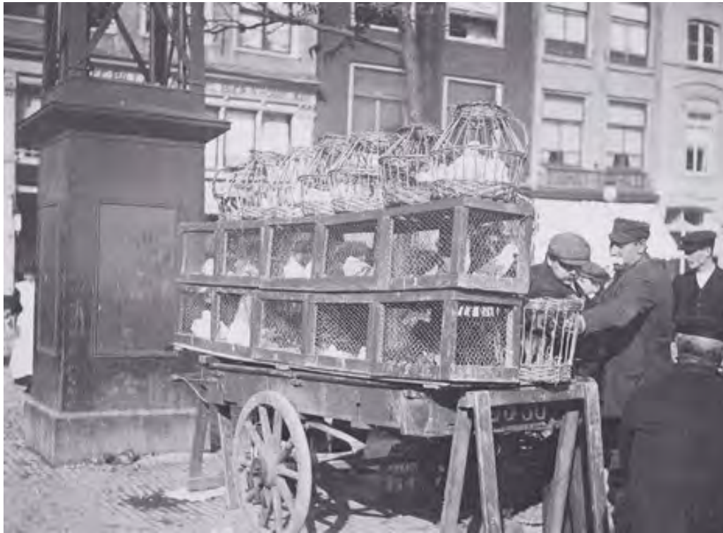
Amsterdam Lindengracht met de duivenmarkt met de duiven in manden, kooien en hokken.