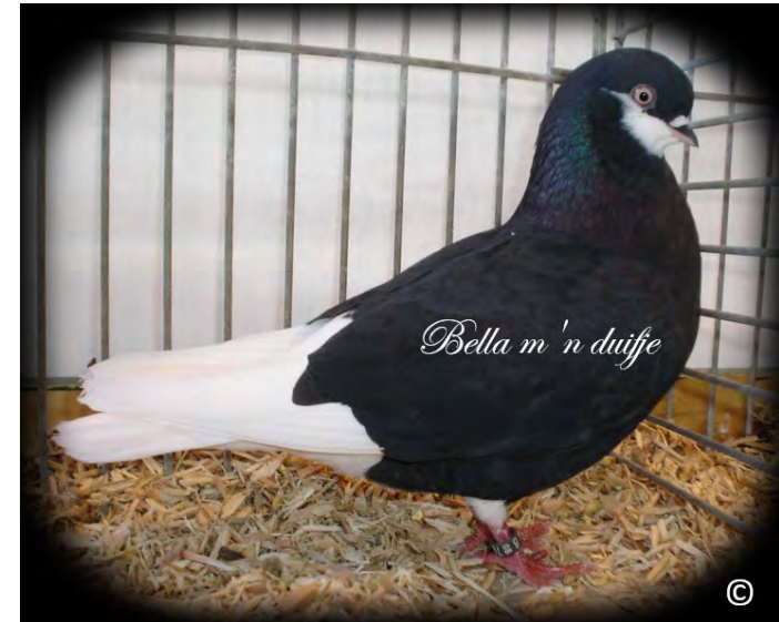
Bella, een 'Engelsmannetje', eerste duivinnetje van Gijsbregt