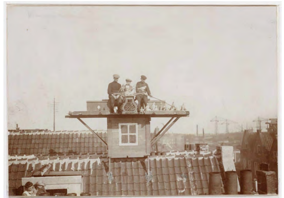
Duivenmelken in 1911, Beeldbank Amsterdam archief https://geheugenvanoost.amsterdam/page/85269/inwoners-en-duivenmelken

https://www.amsterdam.nl/stadsarchief/stukken/dieren/duivenmelken/