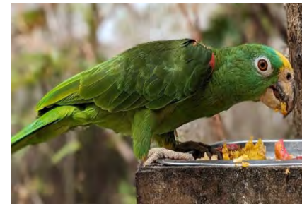
Towie, mijn eerste huisdier