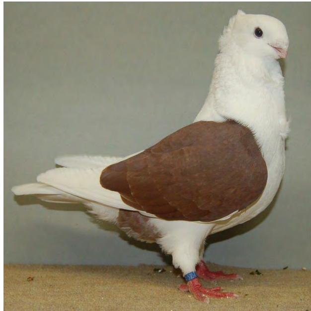
Miep, het 'Oudhollandsche Meeuwjtje', duif van Gijsbregt