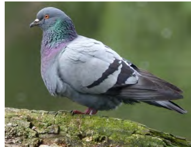
Dirk de Stadsduif / Postduif / Blauwe Bels / halfwilde duif / van Gijsbregt