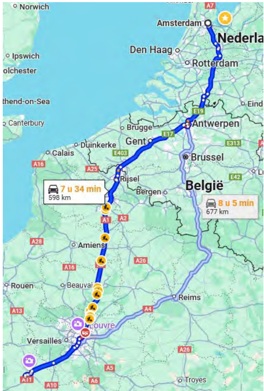
Deze duivenvlucht is ± 600 kilometer van Fontenay-sur-Eure naar Amsterdam .

'n Snelle duif vliegt ± 143 km per uur en doet er dus zo'n viereneenhalf uur over.