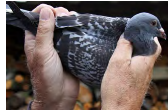
Zo houd je een duif vast