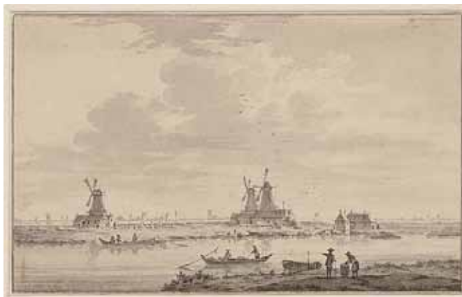
Van de in 17154 gezien naar de dorpen aan de van het IJ met op de voorgrond van links naar rechts de houtzaagmolens De Liefde, Het Fortuin en De Hoop. Tekening van P.J. van Liender in de historisch-topografische atlas van de Gemeentelijke Archiefdienst

Het wapen van Baambrugge vertoonde drie zilveren zuilen op een rood veld, afkomstig van de ambachtsheren uit het geslacht Van Zuylen. Het Vreelandse wapen was ingewikkelder; het bestond uit een rode burcht met een blauw dak, waarboven een rood schild met een zilveren kruis en daarvoor