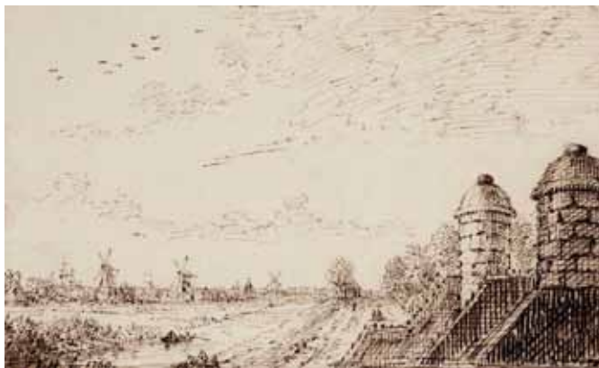
Van bolwerk Oosterbeer in 1759 gezien over de Stadsrietlanden, de Nieuwe Vaart en de Zeeburgerdijk. De molens zijn van links naar rechts de houtzaagmolens Het Fortuin en De Hoop en één der stadvuilwatermolens. De andere, iets meer naar links, is al van zijn wieken ontdaan in verband met de verplaatsing naar de Kadijk bij de Oetewaler sluis. Tekening van S. Fokke in de historisch-topografische atlas van de Gemeentelijke Archiefdienst.

van dezelfde naam hadden laten bouwen. In december 1849 en februari 1850 vonden ten overstaan van notaris Johannes Gerhardus Pouw ten behoeve van leden van de familie Besem veilingen en boedelscheidingen plaats. Aan de daarvoor opge- maakte akten 10 ontleen we de volgende beschrijvingen van de