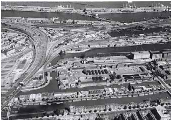
De Stadsrietlanden in 1974. Op de voorgrond het Lozingskanaal en de Nieuwe Vaart.