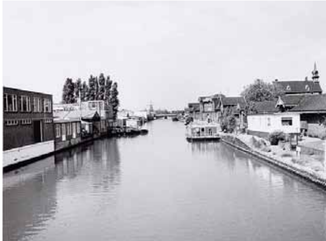
De Nieuwe Vaart met rechts de veemarkt, waarvoor Baambrug en Vreeland moesten wijken. Deze foto werd op 30 juni 1977 door J. M. Arsath Ro'is gemaakt, staande op de brug tussen Molukkenstraat en Veelaan. In de verte voorbij het spoorwegviaduct molen

De stadsadvocaat kon nu de eerste procedure aanspannen voor de arrondissementsrechtbank. Deze werd op 24 februari 1880 met een voor de gemeente gunstige uitslag bekroond, hoewel de conclusie van het Openbaar Ministerie anders geluid had 24 . Ontruiming van de werven zou moeten geschieden twee