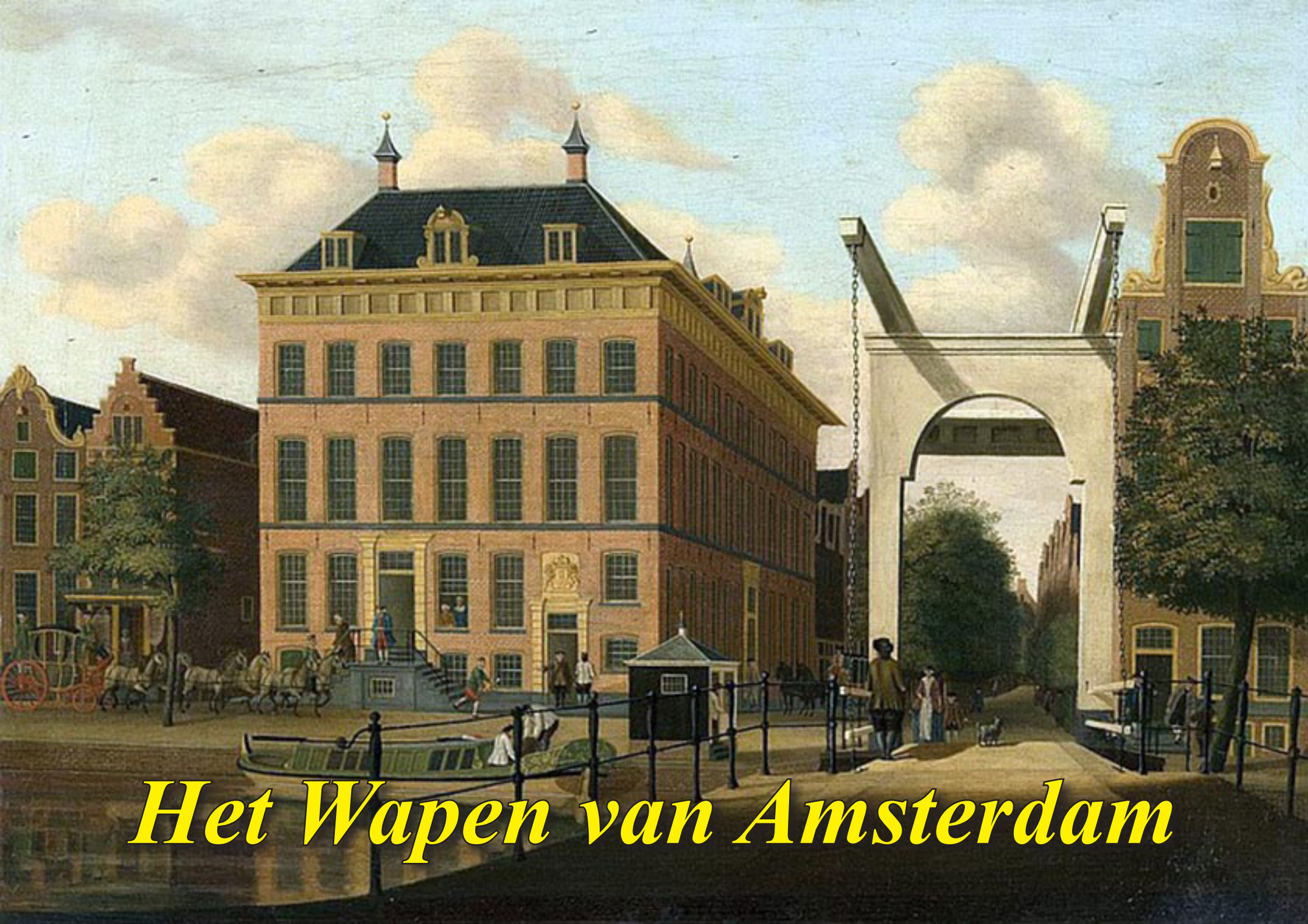
Het Wapen van Amsterdam