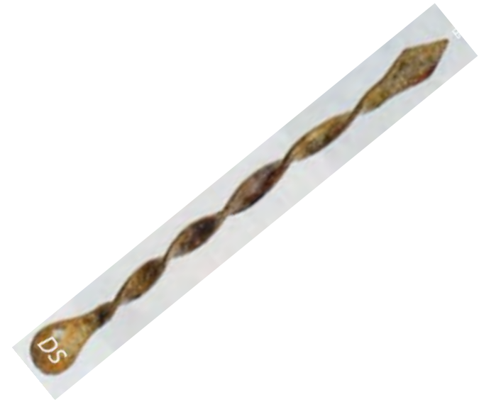
oorreiniger c.q. nagelreiniger van Dirck S