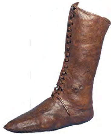
geitenleren dameslaarsje 1225 – 1250

Onder in de dikke baggerlaag, die was afgezet in de uitgesleten Amstelbedding ter hoogte van Hotel Polen, werd op circa 10 meter onder NAP een Andennekan uit de Belgische Maasvallei gevonden. De kan dateert uit het einde van de twaalfde eeuw.