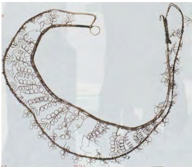
ijzeren crinoline (petticoat)