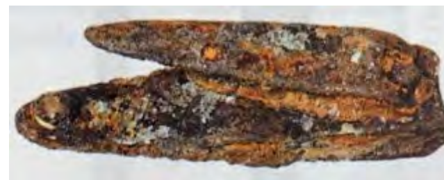
kledingspeld van verchromd ijzer