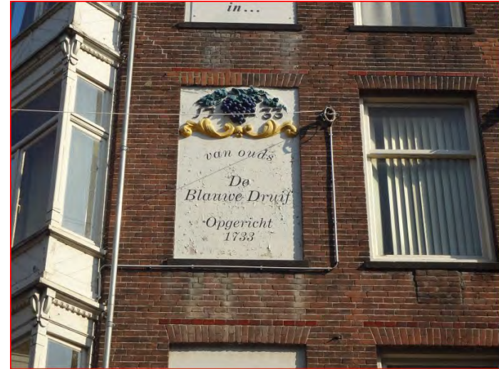
Gevel 'Café De Blauwe Druif' Haarlemmerstraat 91