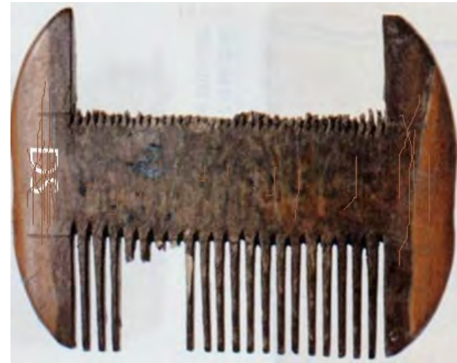
ivoren kam (ook van Dirck S?)