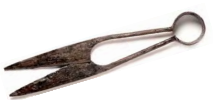
knijpschaar 1200 - 1225

Knijpschaar | De oudste schaarvorm is de knijpschaar, de nu gangbare scharnierschaar komt pas op in de vijftiende eeuw.