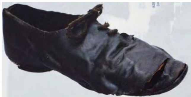
eeuwenoude schoen 1350 – 1550