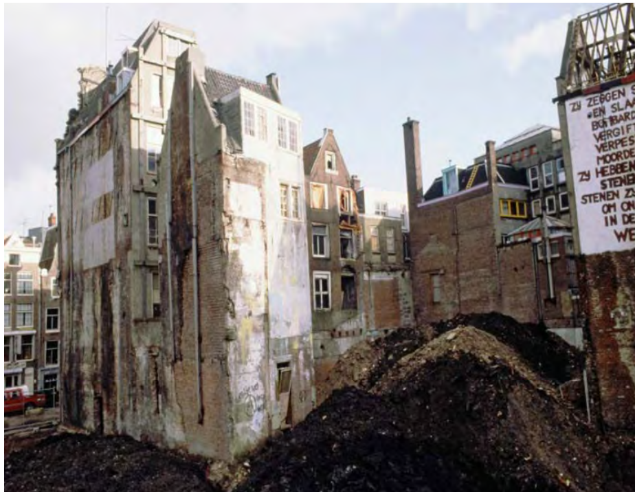
Achterzijde van de huizen aan de Nieuwezijds Kolk en de Nieuwendijk gezien vanaf de Dirk van Hasseltssteeg. Onder het gronddepot wordt later de versterking ontdekt.

↓ extra info opgravingen noordzuidlijn ↓