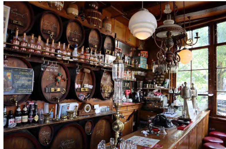
'Café De Druif' Rapenburgerplein 83

https://indebuurt.nl/amsterdam/gids/cafede-druif/