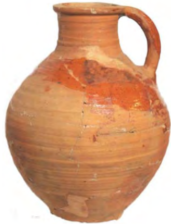
Andennekan 1175 – 1200

Onder in de dikke baggerlaag, die was afgezet in de uitgesleten Amstelbedding ter hoogte van Hotel Polen, werd op circa 10 meter onder NAP een Andennekan uit de Belgische Maasvallei gevonden. De kan dateert uit het einde van de twaalfde eeuw.