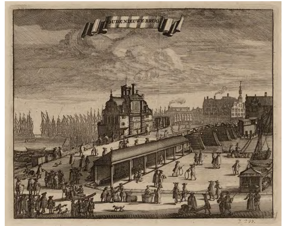
The Nieuwe Brug, seen from the west, presented as an open public space. In the centre the Paalhuis and in the foreground the gallery of the shipping exchange