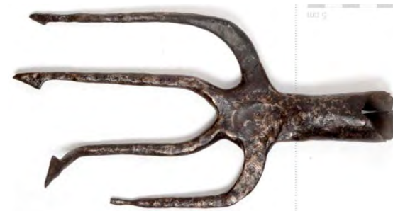
vleesvork 1225 – 1275

Vleesvork | Het gaat hier om een vork met vier dikke tanden voorzien van weerhaken. Hiermee kon het vlees worden vastgezet en als bij een spit boven een vuur worden gehouden. Op zijn tijd werden dus flinke stukken vlees geroosterd.