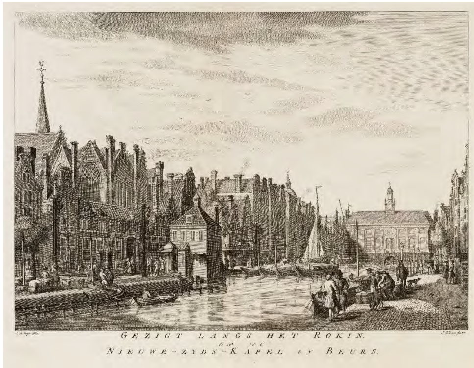
View along Rokin in northerly direction. At the left the Nieuwezijds Kapel and the Rotterdam ferry. In the background the Stock Exchange of 1611 by Hendrick de Keyser