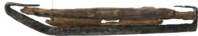
schaats 1225 – 1250

Vleesvork | Het gaat hier om een vork met vier dikke tanden voorzien van weerhaken. Hiermee kon het vlees worden vastgezet en als bij een spit boven een vuur worden gehouden. Op zijn tijd werden dus flinke stukken vlees geroosterd.