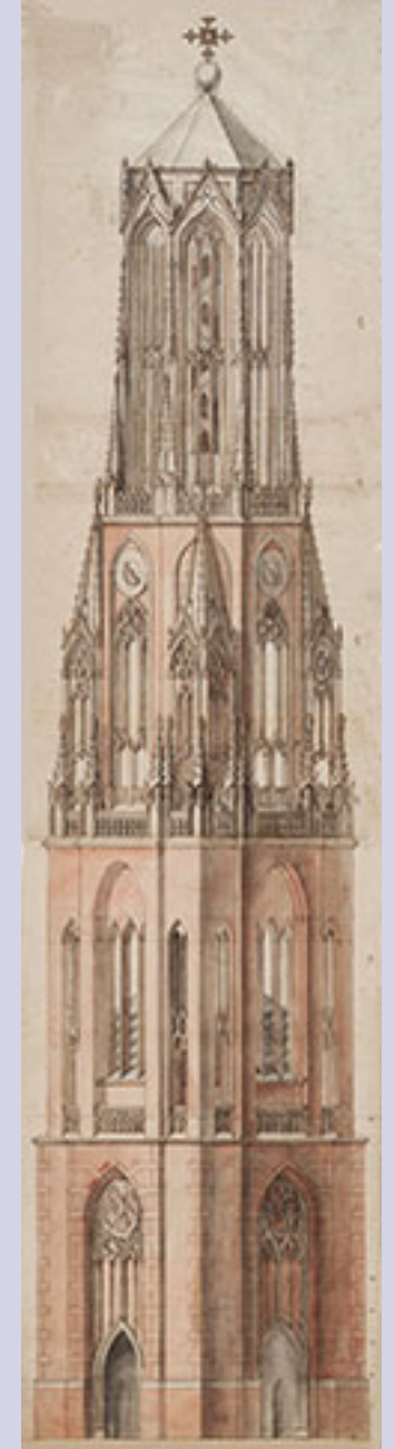
Er zijn heel wat ontwerpen gemaakt voor de te bouwen toren; v.l.n.r. onbekend, Jan Adriaansz Leeghwater, Jacob van Campen met maquette en Willem de Keyser