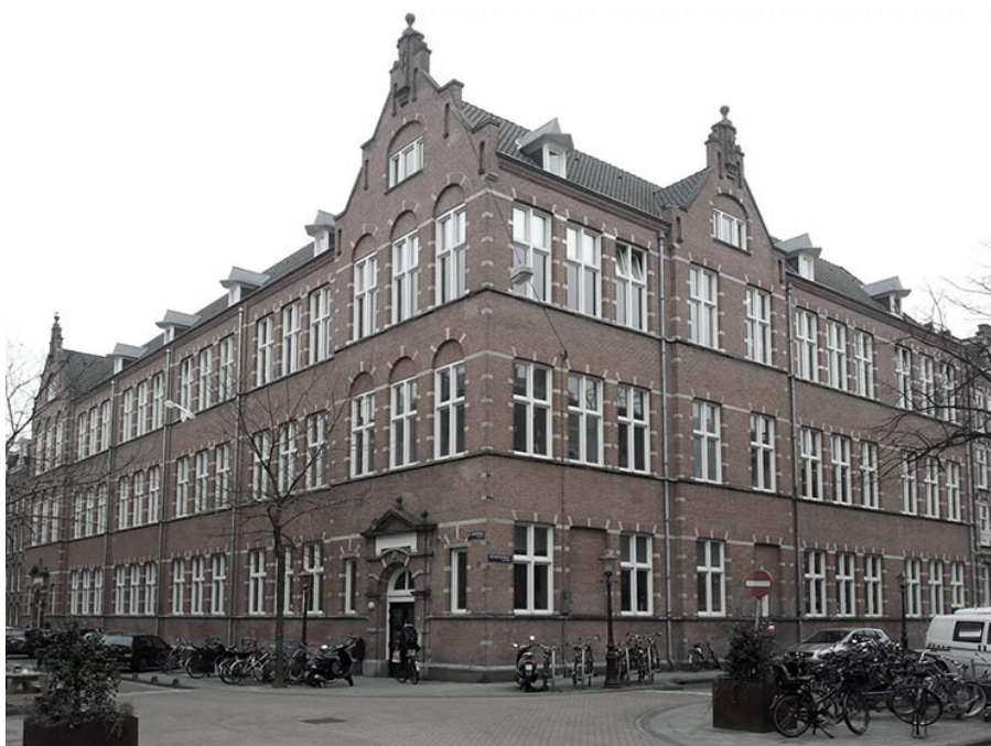
◀ De Zevende-3 kreeg in 1920 plek in een schoolgebouw in de Da Costastraat 36