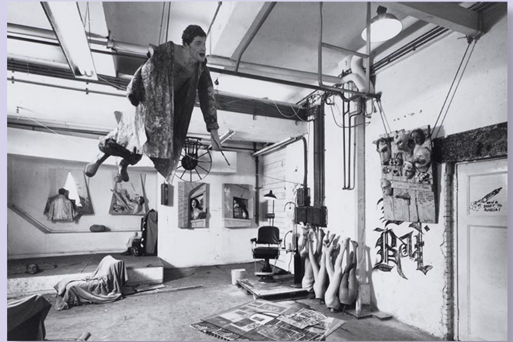
▲ Galerie Amok in het Handelsbladcomplex