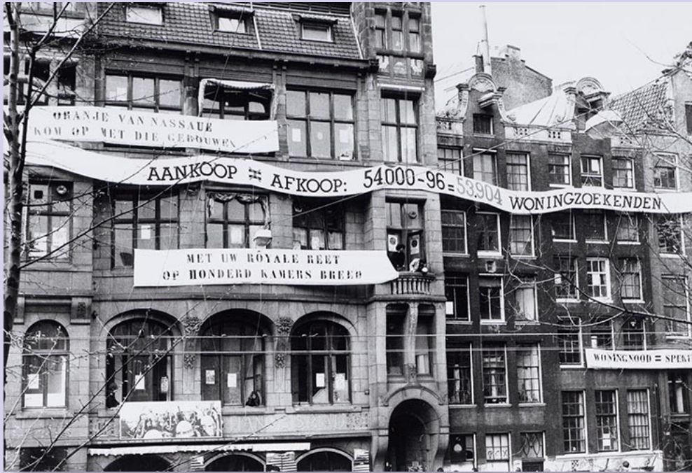
▲ Spandoeken in 1980