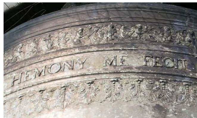
Signatuur van P. Hemony op de klok van de Oosterkerk (Amsterdam)