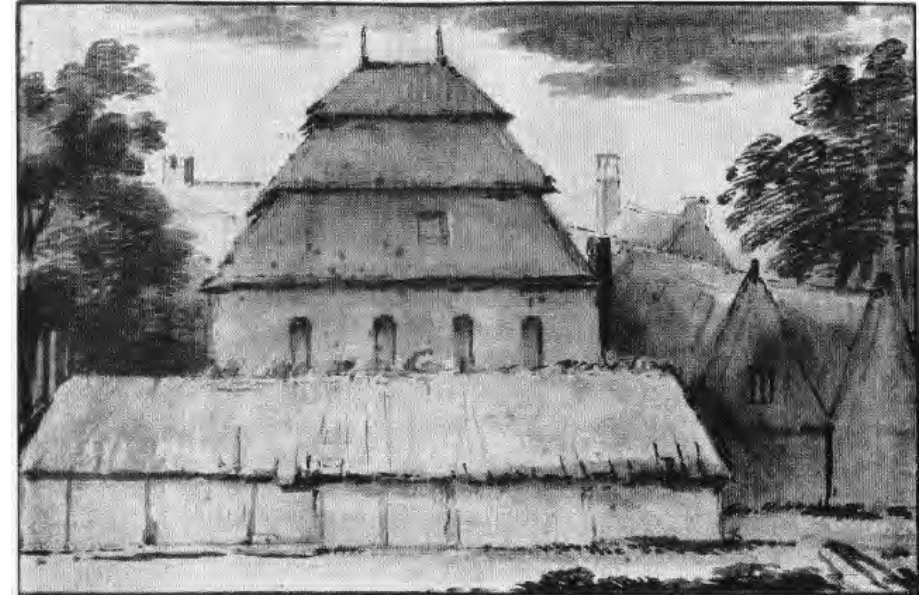
De amsterdase klokken- en geschutgieterij van François en Pieter Hemony zoals deze geschetst werd door Van den Eekhout, een leerling van Rembrandt. (Topografische atlas, Gem. Archief Amsterdam).

Tof beiaardboek dat ik kreeg (verjaardag)