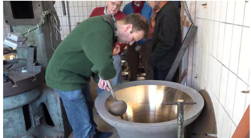
De klokkengieter aan het werk

https://www.youtube.com/watch?v=KOZv4_NyGYk