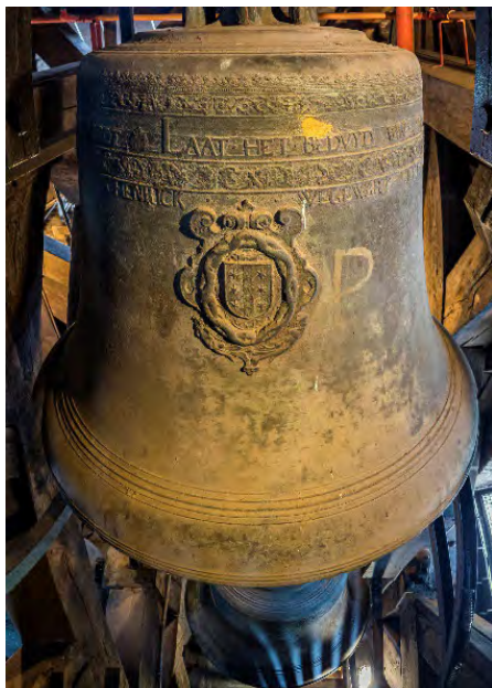
En één van de Bossche speelklokken

In 1676 krijgt de Sint-Jan te Den Bosch een nieuw klokkenspel, ook wel 'beiaard' genoemd. Het nieuwe klokkenspel is van een bekende beiaardbouwer, Hemony. In de zeventiende eeuw is een mooi klokkenspel, vooral een van Hemony, een prestigieus bezit. Er is namelijk een soort wedstrijd tussen de Nederlandse steden gaande wie het mooiste klokkenspel heeft en Gouda wil niet achterblijven bij de andere steden. Vanaf de Middeleeuwen tot ver in de vroegmoderne tijd bepalen