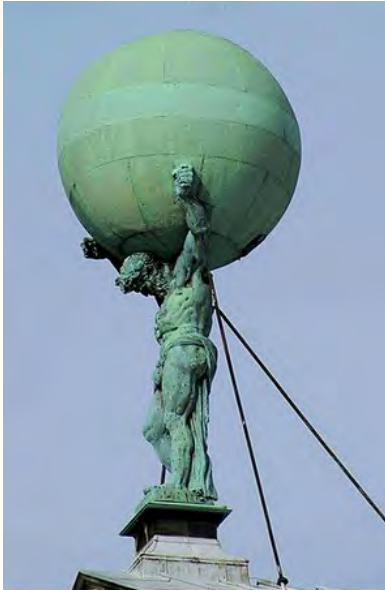
Atlas op het Paleis op de Dam, gegoten door Hemony

https://nl.wikipedia.org/wiki/Pieter_en_Fran%C3%A7ois_Hemony