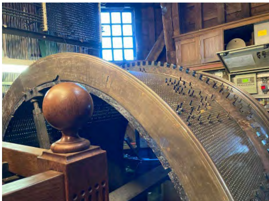
De Sint Jan - toren met klokkenspel in Den Bosch De Bossche speeltrommel