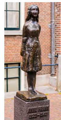
Beeld Anne Frank