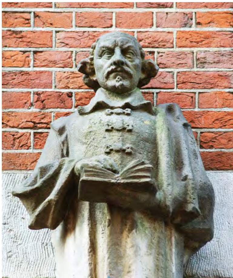
Beeld Vondel door Gerarda Rueter / Warmoesstraat 110