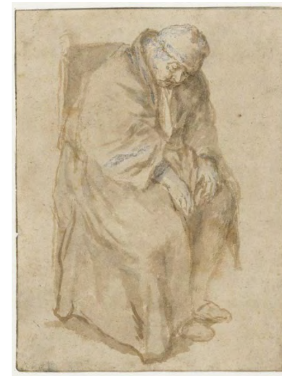
Joost van den Vondel op 91-jarige leeftijd, door Philips Koninck.