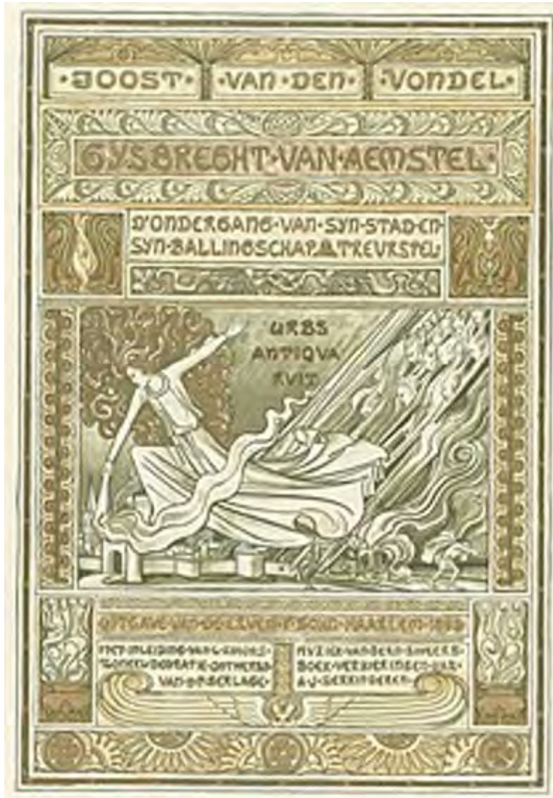
'Gysbreght van Aemstel', Toneelstuk van Vondel