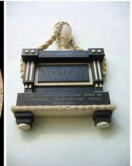
Vondels Grafmonument uit 1772