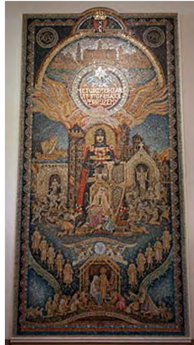
'Mozaïek van Gysbreght' in de 'Stadsschouwburg te Amsterdam'