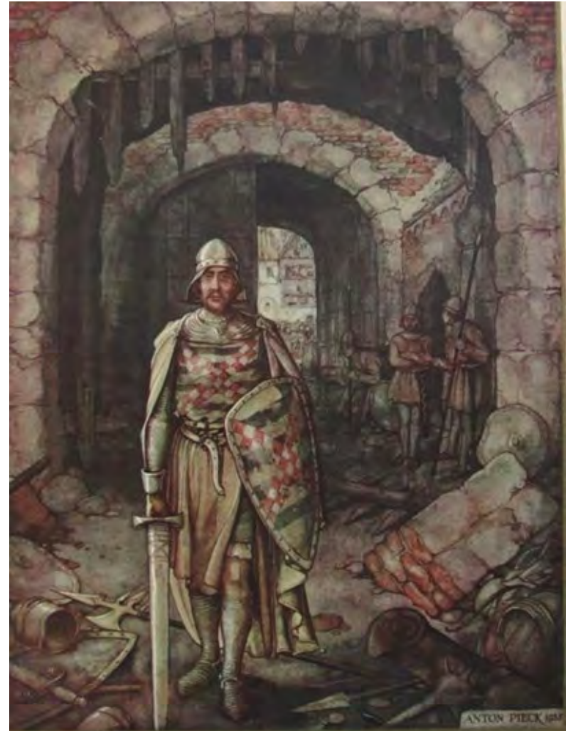
'Gijsbreght' door Neerlandsch toptekenaar Anton Pieck

zie: https://www.google.nl/search?q=joost+van+den+vondel+pentekening&cof=FORID:11&hl=NL&gl=nl&ie=UTF-8&udm=2#vhid=3QGlvhWwmyjaJM&vssid=mosaic