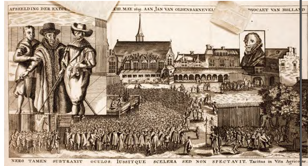
Executie van Van Oldenbarnevelt in het Vondeliaanse toneelstuk 'Palamedes'.

Vondel gaf het stuk de titel: 'Gysbrecht van Aemstel, d'ondergang van zijn stad en zijn ballingschap. Treurspel.' Hij draagt het stuk op aan Hugo de Groot, die in 1638 als balling in Frankrijk leefde. De Groot was verbannen nadat hij betrokken was geraakt bij de religieuze richtingenstrijd tussen remonstranten en contraremonstranten. Zijn ideaal was het herstel van de eenheid van alle christenen in een terugkeer naar de situatie van de oude kerk in de eerste eeuwen na Christus. Vondel besluit zijn, aan de door hem bewonderde Here Huig de Groot gerichte inleiding, met de woorden: 'Ik offer Uwe Exc. in zyne ballingschap mynen Gysbrecht van Aemstel, den godvruchtigen en dapperen balling'. Het stuk speelt in Amsterdam, tijdens een kerstnacht omstreeks 1300 en gaat over de belegering van de stad door manschappen uit omliggende dorpen, verenigd in de Kennemers en Waterlanders. Aanleiding is de vermeende betrokkenheid van Gijsbrecht en zijn bondgenoten Gerard van Velsen en Herman van Woerden bij de ontvoering en moord op Floris V in 1296. De vijandelijke soldaten lijken zich terug te trekken, maar duiken als gevolg van een list onverwacht weer op. Na hevige gevechten is Gijsbrecht gedwongen, met zijn vrouw Badeloch en hun kinderen, naar Pruisen te vluchten, waar hij een 'Nieuw Holland' zal stichten. Bron: https://nl.wikipedia.org/wiki/Gijsbrecht_van_Aemstel