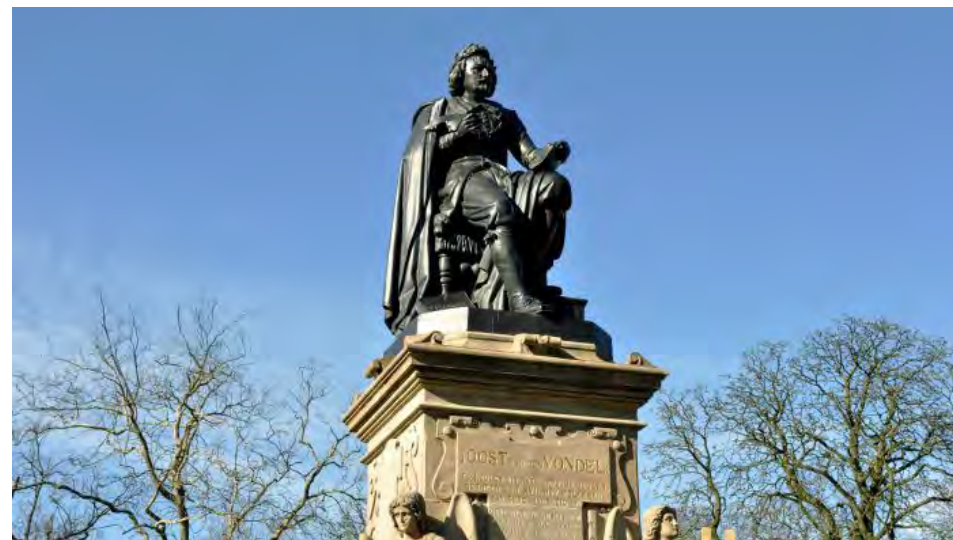
Beeld in Vondelpark/bron: https://amsterdam.kunstwacht.nl/kunstwerken/bekijk/470-joost-van-den-vondel

https://nl.wikipedia.org/wiki/Standbeeld_Joost_van_den_Vondel#/media/Bestand:2020_Vondel_Warmoesstraat_(1).jpg