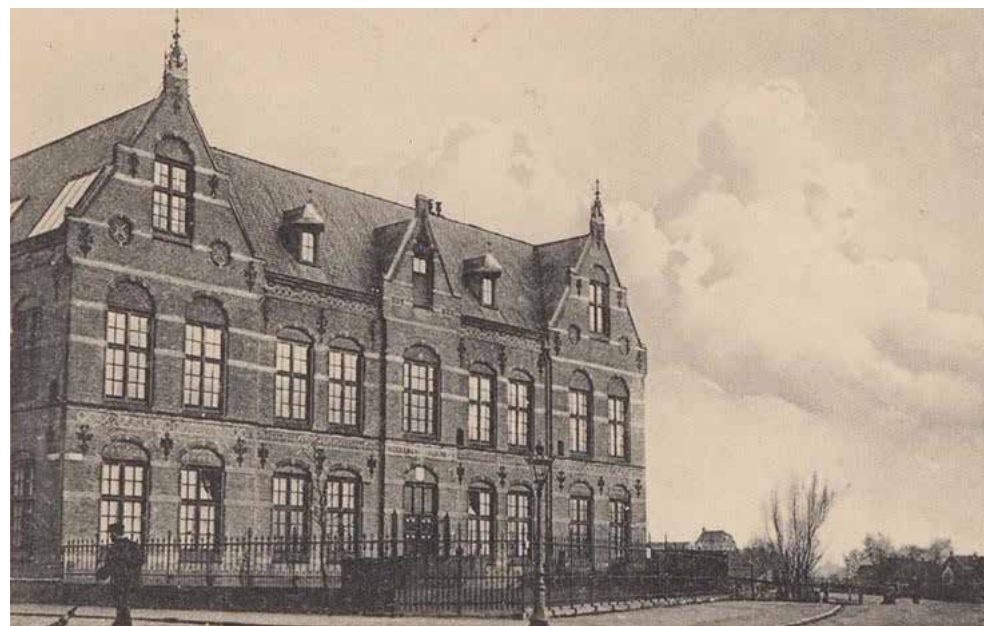
Afb.4. De Nieuwer-Amstelse H.B.S. aan de Roelof Hartstraat, kort na 1894. Rechts in het verschiep de Nieuwer-Amstelse verbindingsweg die naar de brug over de Boerenwetering ter hoogte van de Rustenburgerstraat leidt.

B. en W. zijn ook wel voor de oprichting maar zien tegen de kosten op. Oprichting nu betekent volgens de tegenstanders de financiële ondergang van de gemeente. Er wordt opgemerkt dat wanneer het gemeentebestuur teveel geld uitgeeft, de belastingen sterk zullen moeten stijgen en als dat gebeurt kan Nieuwer-Amstel straks wat belastingen betreft wel worden samengevoegd met Amsterdam 26 . Uit deze opmerking blijkt overigens duidelijk de vrees dat het noordelijk deel van Nieuwer-Amstel te veel op Amsterdam zal gaan lijken. En hoe minder het noordelijk deel verschilt van Amsterdam, des te méér reden is er om tot annexatie over te gaan. Uiteindelijk besluit men toch een H.B.S. op te richten. Na enig aarzelen kiest men voor een terrein aan de nieuwe verbindingsweg,