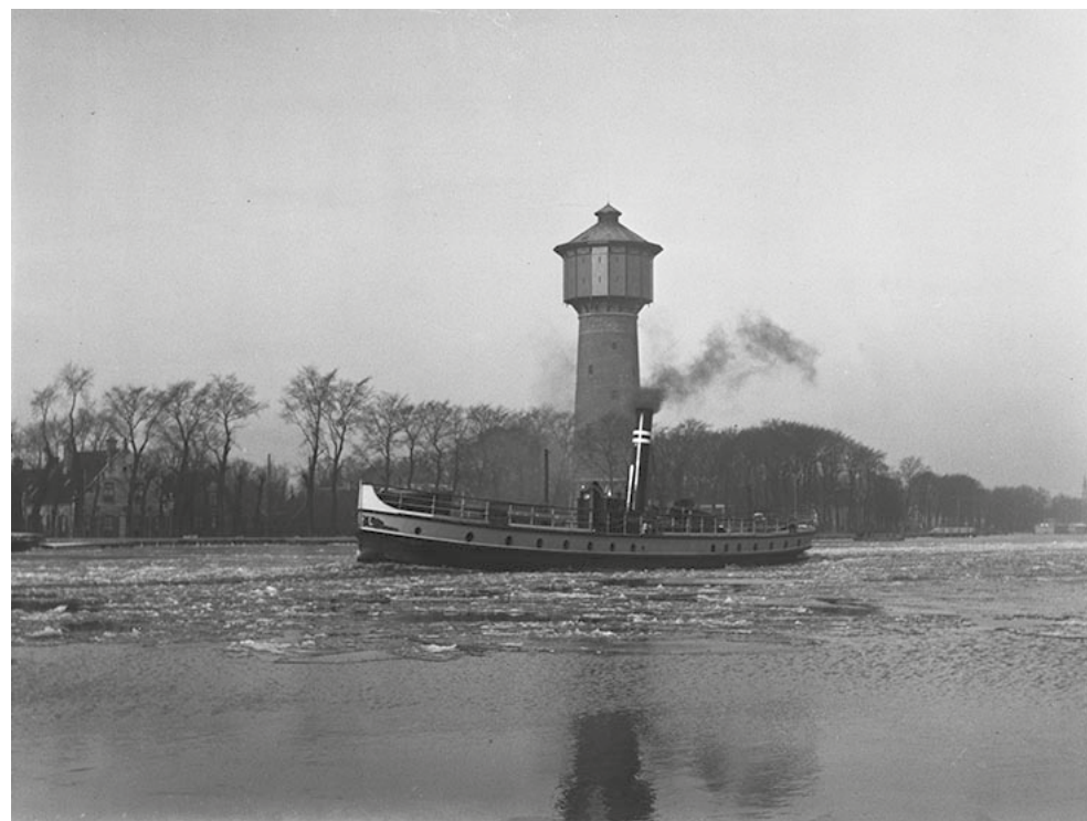
Afb.3. De watertoren van de Nieuwer-Amstelse bronwaterleiding aan de Amsteldijk. Behalve deze toren heeft Nieuwer-Amstel ook een pompstation gebouwd in Hilversum. Totale kosten: 774.000 gulden. De toren is in 1928 gesloopt.

Eind jaren tachtig, begin jaren negentig houdt het Nieuwer-Amstelse gemeentebestuur zich intensief bezig met het tot stand brengen van nieuwe voorzieningen voor het sterk gegroeide aantal inwoners van het noordelijke deel van Nieuwer-Amstel. Tussen 1886 en 1888 wordt een eigen drinkwaterleiding aangelegd (zie afb. 3) en tussen 1887 en 1892 worden de verschillende delen van de verbindingsweg voltooid. De politie wordt gereorganiseerd, er komt een beroepsbrandweer met kazerne (1892) schuin tegenover het