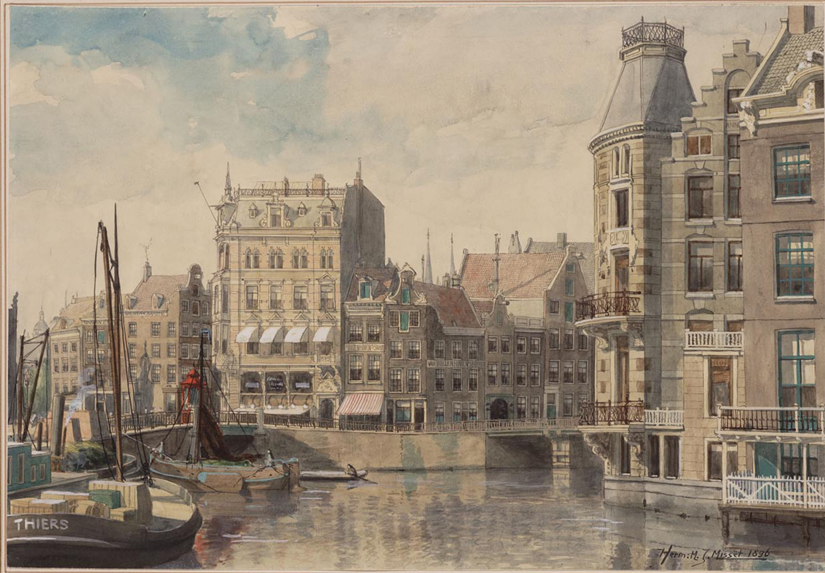
Het ROKIN by het MONTPLEIN Omstr. 1896. H. M. Misset.