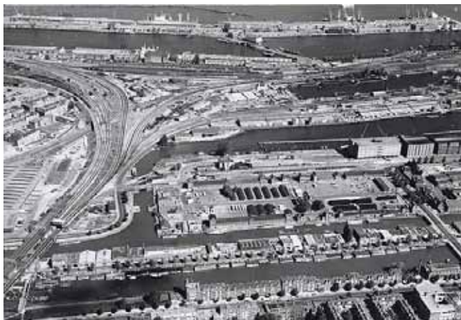
De Stadsrietlanden in 1974. Op de voorgrond het Lozingskanaal en de Nieuwe Vaart.