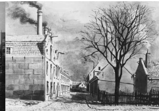
Wenslauerstraat omstreeks 1909