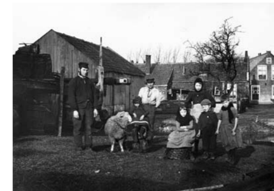
Kwakerspad en omgeving omstreeks 1893