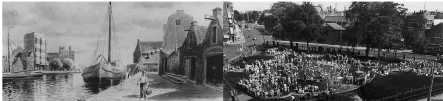
Kostverlorenkade rond 1930