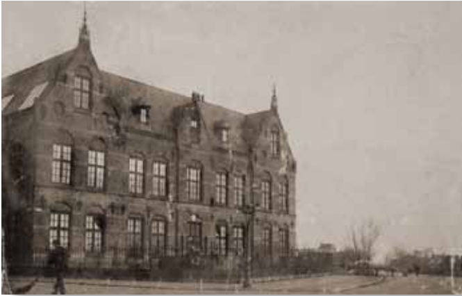
Afb.4. De Nieuwer-Amstelse H.B.S. aan de Roelof Hartstraat, kort na 1894. Rechts in het verschieft de Nieuwer-Amstelse verbindingsweg die naar de brug over de Boerenwetering ter hoogte van de Rustenburgerstraat leidt.

van het hebben van een H.B.S. Het gemeentebestuur verklaart dat er onder de inwoners van Nieuwer-Amstel te weinig belangstelling blijkt te zijn en dat de bevolking ook te verspreid woont 25 . Pas zeven jaar later, tijdens de raadsvergadering van 6 mei 1892 wordt er serieus gediscussieerd over stichting van een H.B.S. De voorstanders merken op dat het noordelijke deel van Nieuwer-Amstel nu ongeveer 22.000 inwoners telt en daarmee veel groter is dan geheel Zutphen met 13.974 inwoners of Tiel met 9.456 inwoners. Beide gemeenten hebben al lang een H.B.S.