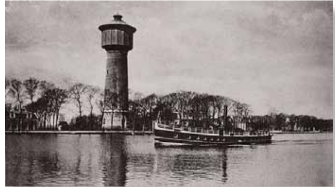
Afb.3. De watertoren van de Nieuwer-Amstelse bronwaterleiding aan de Amsteldijk. Behalve deze toren heeft Nieuwer-Amstel ook een pompstation gebouwd in Hilversum. Totale kosten: 774.000 gulden. De toren is in 1928 gesloopt.

Eind jaren tachtig, begin jaren negentig houdt het Nieuwer-Amstelse gemeentebestuur zich intensief bezig met het tot stand brengen van nieuwe voorzieningen voor het sterk gegroeide aantal inwoners van het noordelijke deel van Nieuwer-